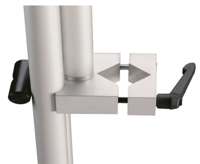
Universal-Klemmkopf bei GPS950F