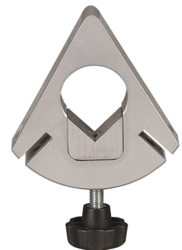
Universal-Klemmkopf bei GPS950F